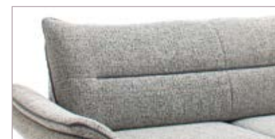
Rücken mit Keder (Standard)