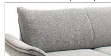
Rücken glatt (Variante)